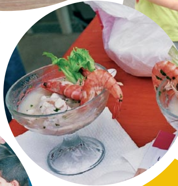
leche de tigre