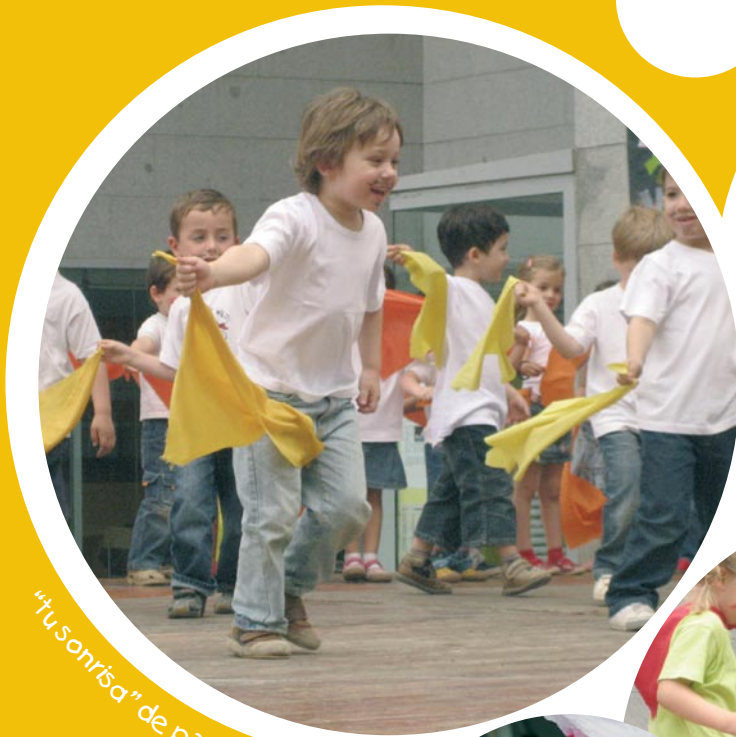
"fusonisa" de p3