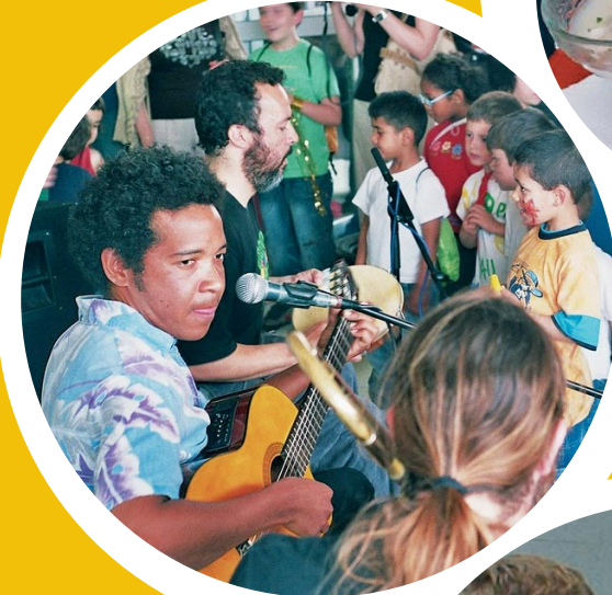
els músics de brasil