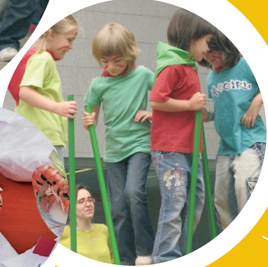
la patum de p4